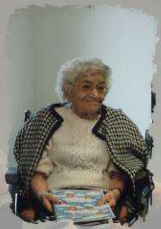
Salle la Parenthèse