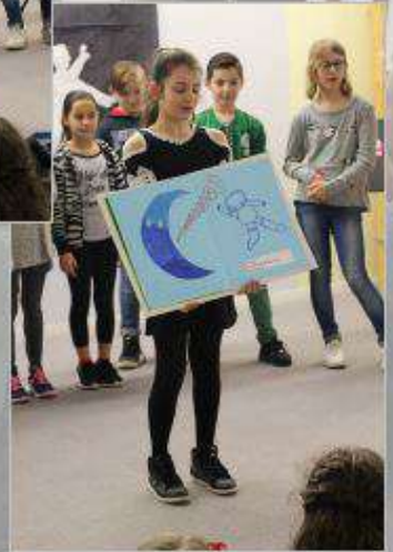
Pendant ce temps là, à la bibliothèque.