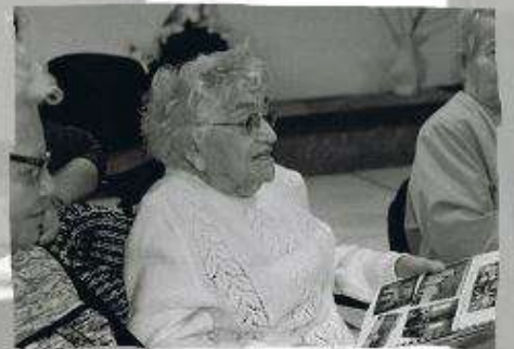
Photographies argentiques réalisées par le Club Photo "Le Décllic".